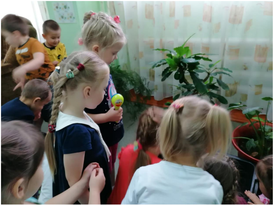
Растения в нашем живом уголке