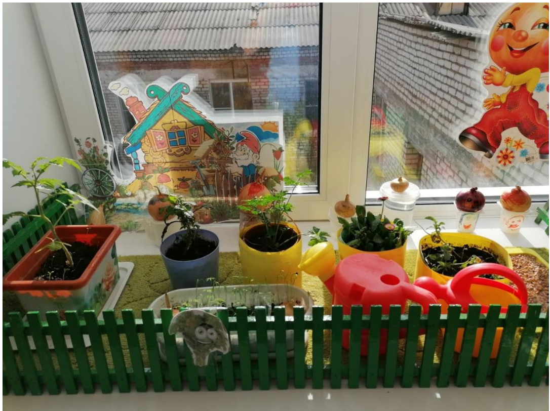
Растения на нашем окне